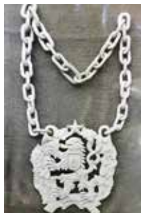
Řád bílého lva 1. stupně s řetězem

Tou další radostí, která mu přirostla k srdci, je řezbářství. Patří k předním a nejstarším řezbářům na Těšínsku. „Vyřezal jsem stovky figurek, ale nejen to, vzpomínám si na dvě dřevořezby, o kterých vám chci říci. Ta první, to jsem vyřezal českého lva a polskou orlici,